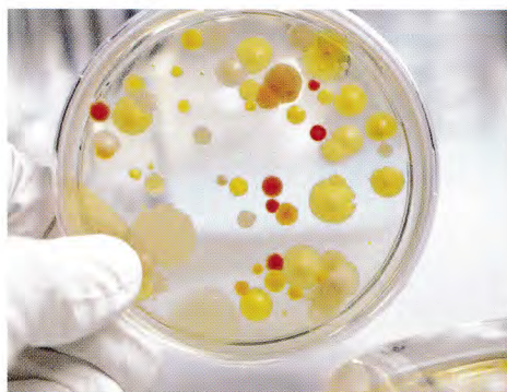
靴の中の雑菌のイメージ

靴の表面（外側）は洗ったり磨くことができます。しかし・・・「靴の内側」はどうでしょうか？革靴を「水と洗剤」でジャバジャバ！とてもそんなことは出来ません。そこはプロに委ねるとしてもクリーニング代も高額なので、そう頻繁には出せません。